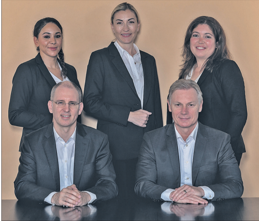
Das Team der Alvoso-Geschäftsstelle.

Die Alvoso Pensionskasse ist eine Sammelstiftung für die berufliche Vorsorge (BVG) für KMU-Betriebe in der Schweiz. Die Stiftung wurde vor über 35 Jahren im Limmattal gegründet. Die Alvoso ist gesamtschweizerisch tätig, mit Schwerpunkt im Wirtschaftsraum Zürich, Ost- und Zentralschweiz. Die operative Geschäftsstelle befindet sich in Schlieren.