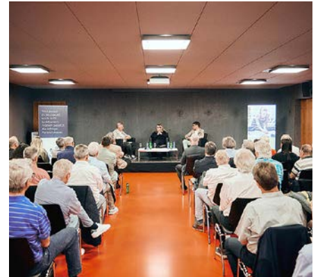
Am 26. Juni zelebrieren wir an unserem Forum 40 Jahre Alvosio Pensionskasse.